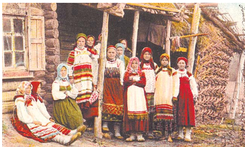
Калужская губерния 1905-1917гг. Открытка издательства «Шерер, Набогльц и К».

В феврале 1861 года уезды губернии были поделены на волости.