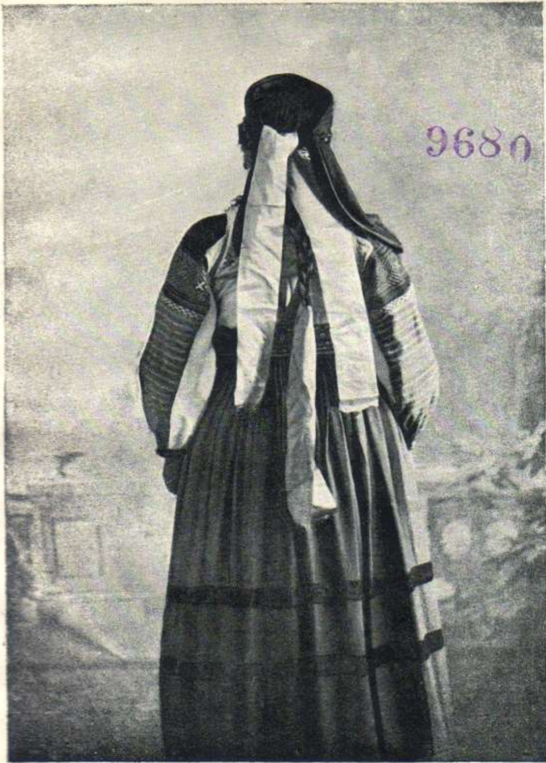
Рисунок № 3

Девушка-гамаюнка в подпластике, рубахе и шубке (сзади)