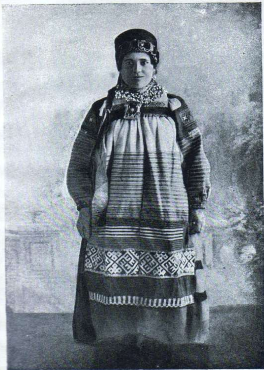
Рисунок № 4

Девушка-гамаюнка в подпластике и чехрах. На шее ожерелье с языком