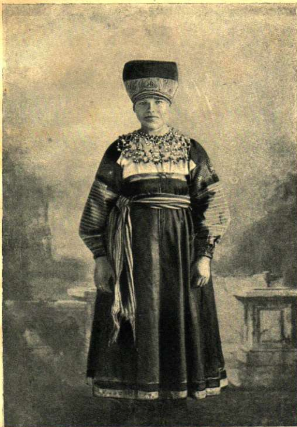
Рисунок № 1

Гамаюнская „молодая“ в китайке и кичке с золотой сорокой