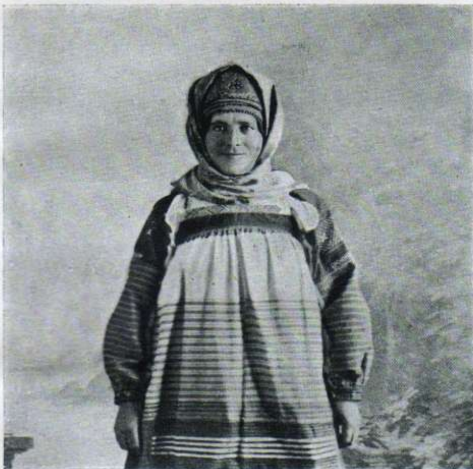
Рисунок № 2

Гамаюнка в золотной сороке, покрытой шалью