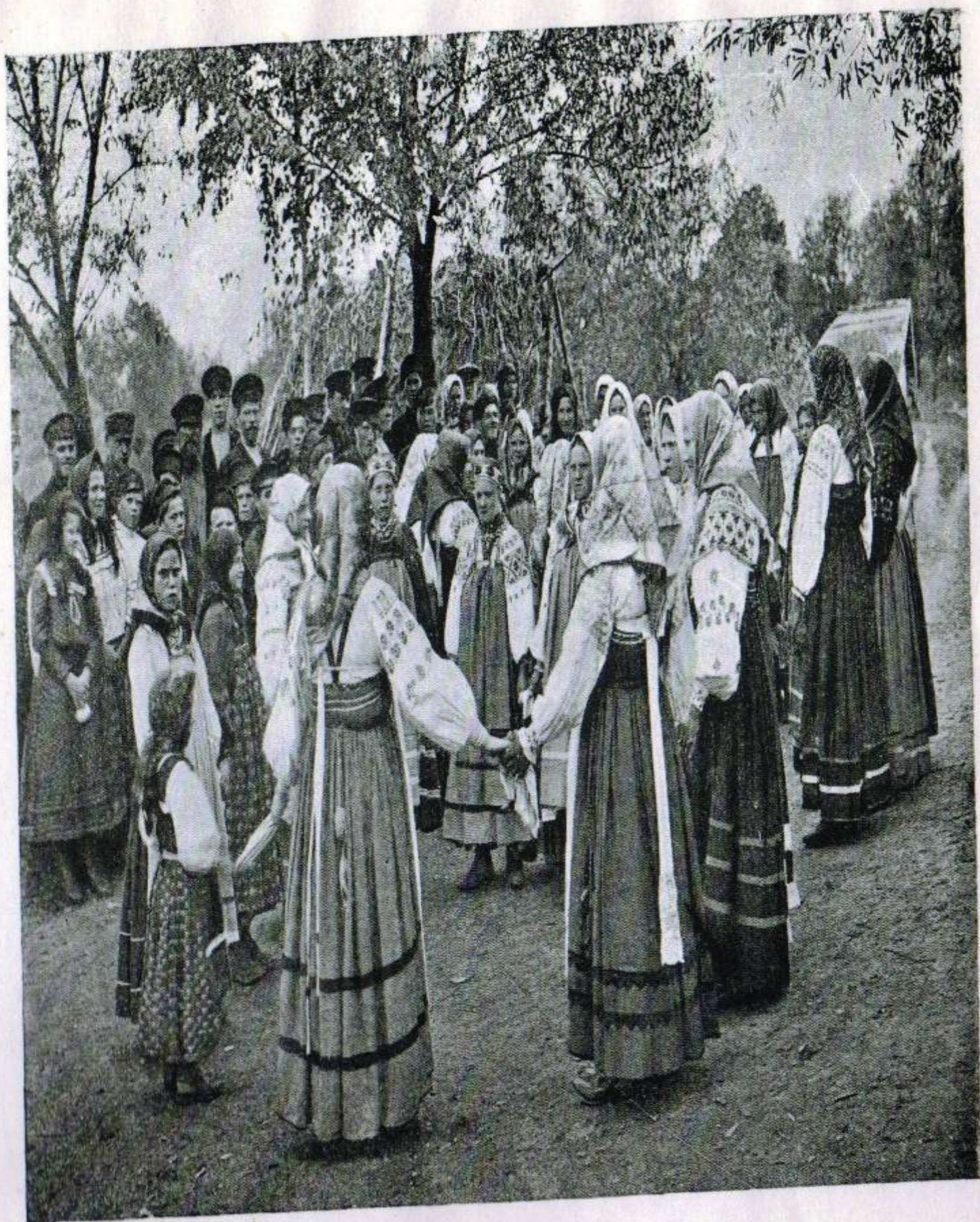
Рисунок № 9