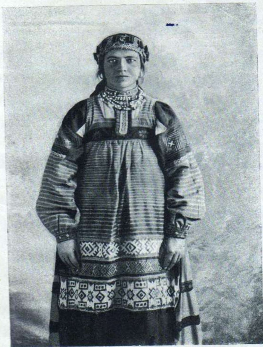
Рисунок № 5

Молодая женщина-гамаюнка в чехрах и языке