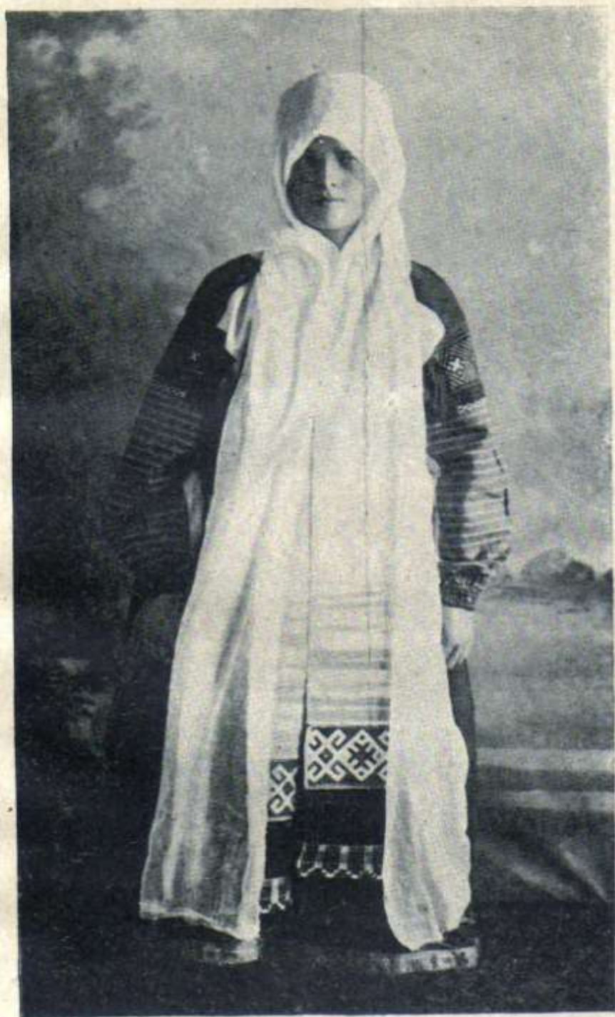
Рисунок № 7