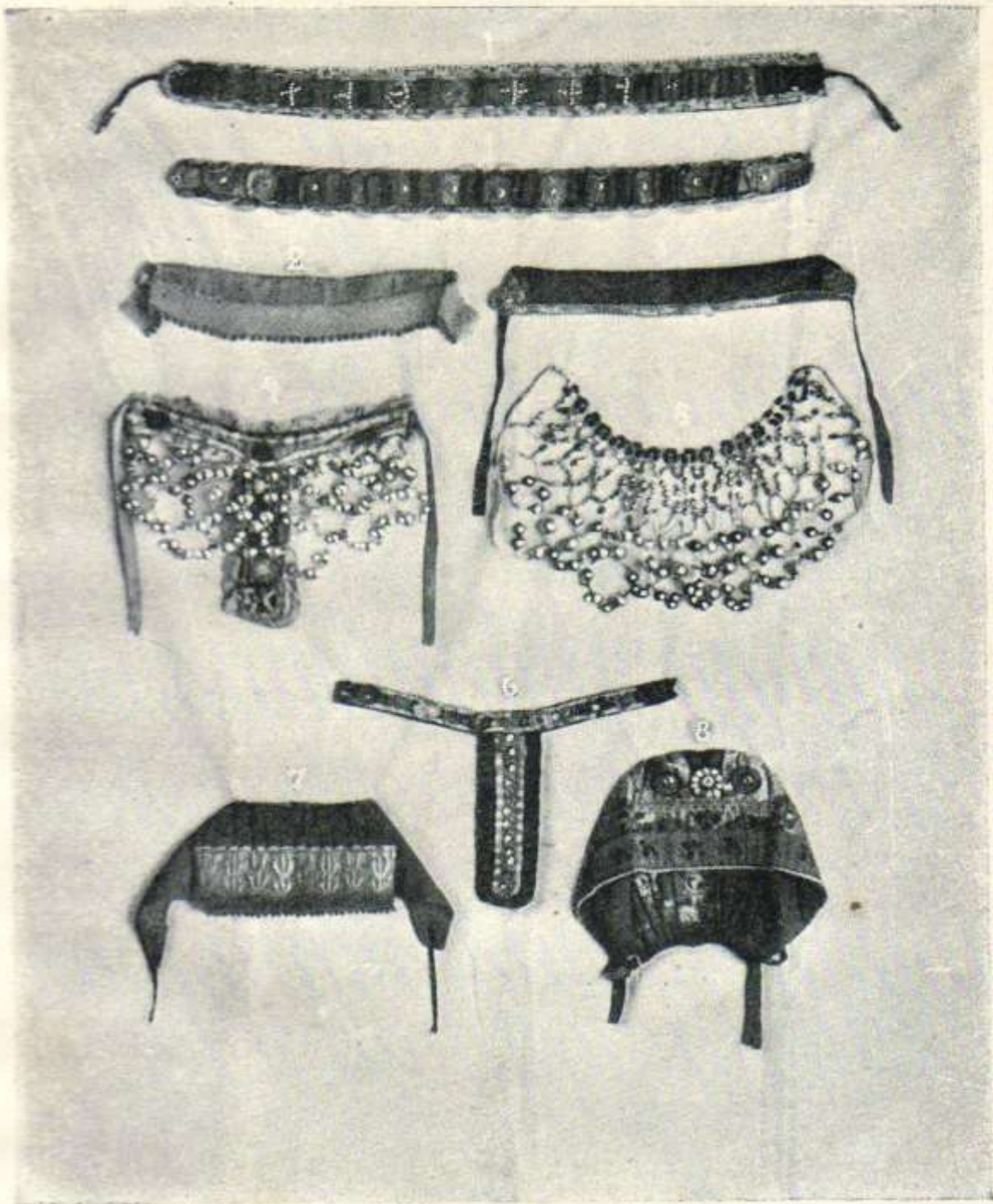
Рисунок № 6