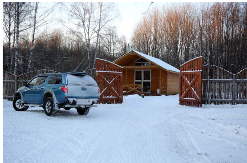
Жилой домик с летней верандой. Фото 2015 г.