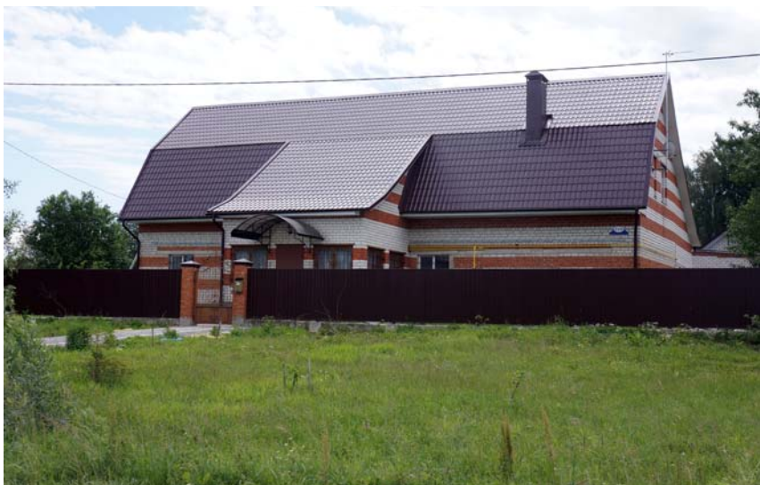
На этом месте до революции 1917 года была земская школа. Фото 2014 г.