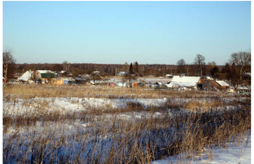
Общий вид приходской д. Некрасово. Фото 2015 г.