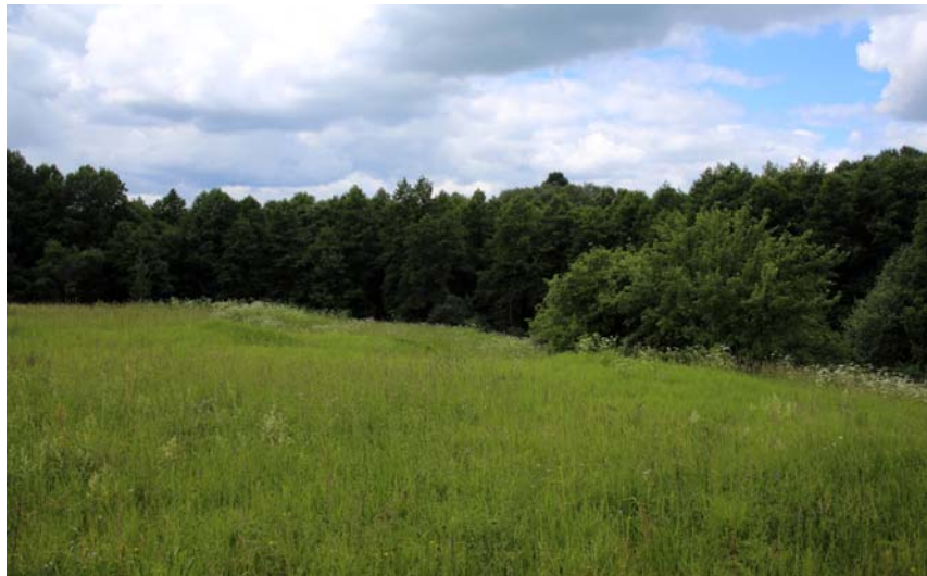
Вид местности, где находилась Успенская церковь на Сельне. Фото 2014 г.