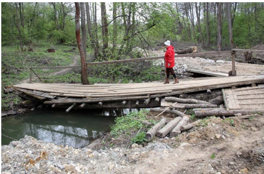
Старый деревянный мост через речку Сельна в районе сельского кладбища. Фото 2014 г.