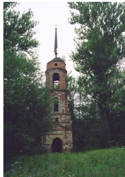
Колокольня Успенской церкви. Фото 2000 г.