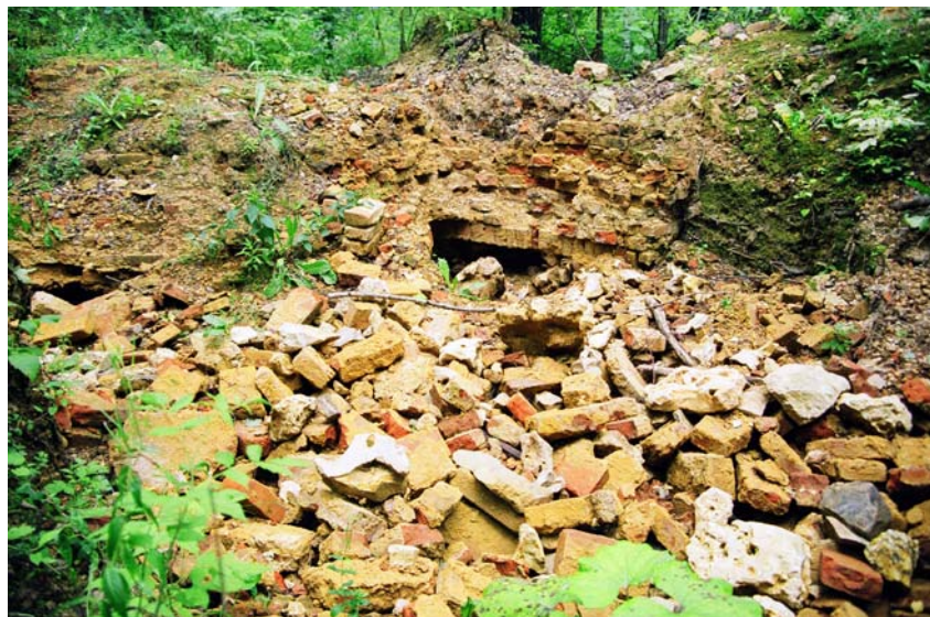
Руины Успенской церкви. Фото 2000 г.