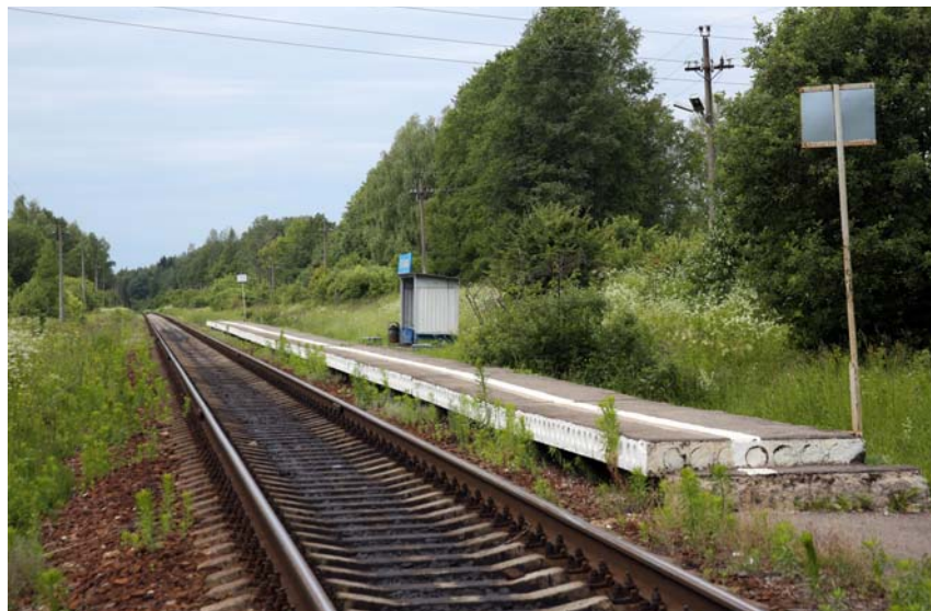
Железнодорожная остановка «Стопкино». Фото 20 июня 2014 г.