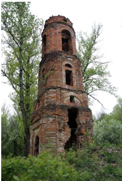
Колокольня Успенской церкви. Фото 2014 г.