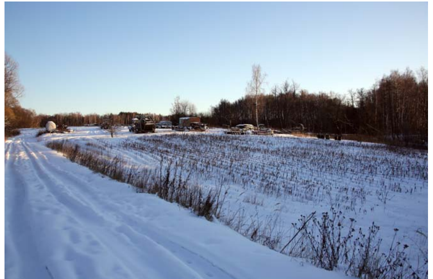
Подсобное хозяйство на территории бывшей д. Муханово. Фото 2015 г.