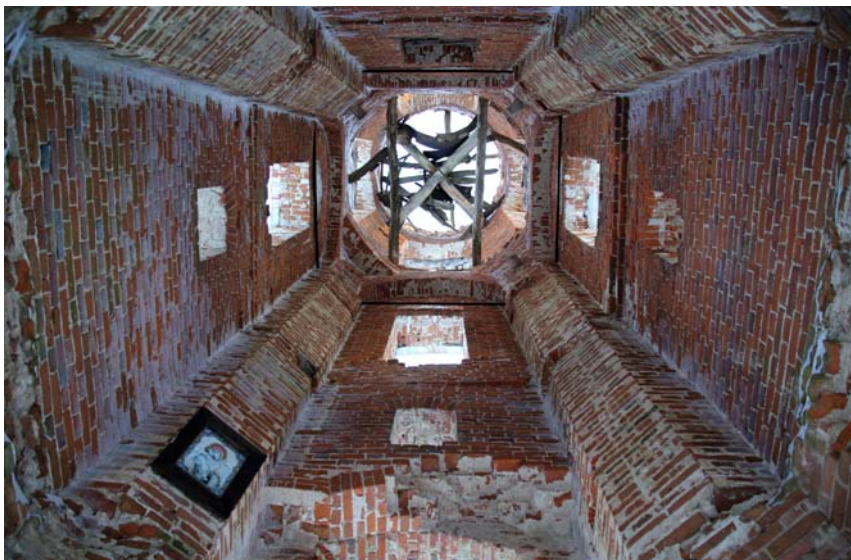
Внутренний вид Успенской церкви. Фото 2015 г.