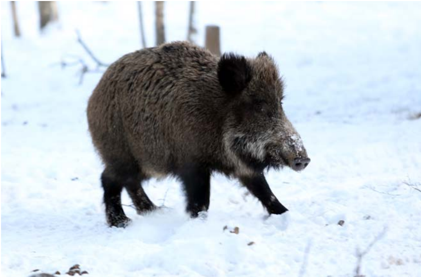
Хозяин звериного царства по имени Дикарь. Фото 2015 г.