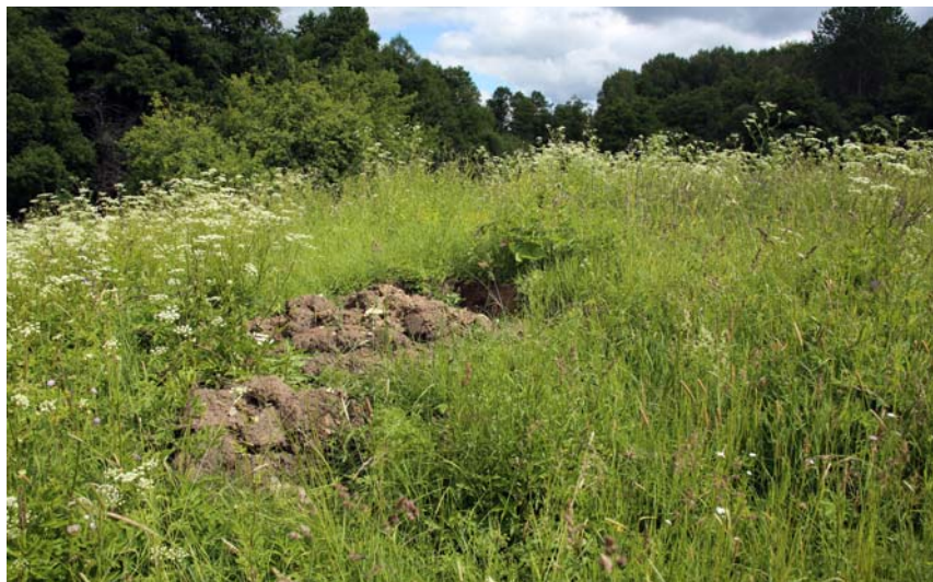
Раскоп на месте старой Успенской церкви. Фото 2014 г.