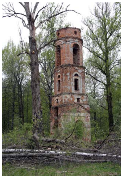
Вид на колокольню с юго-восточной стороны. Фото 2014 г.