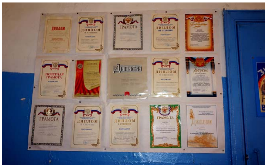
Дипломы и грамоты сельского дома культуры. Фото 2014 г.