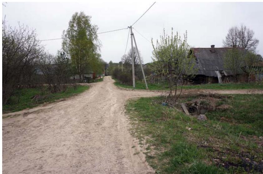
Центральная улица д. Филисово. Фото 2014 г.