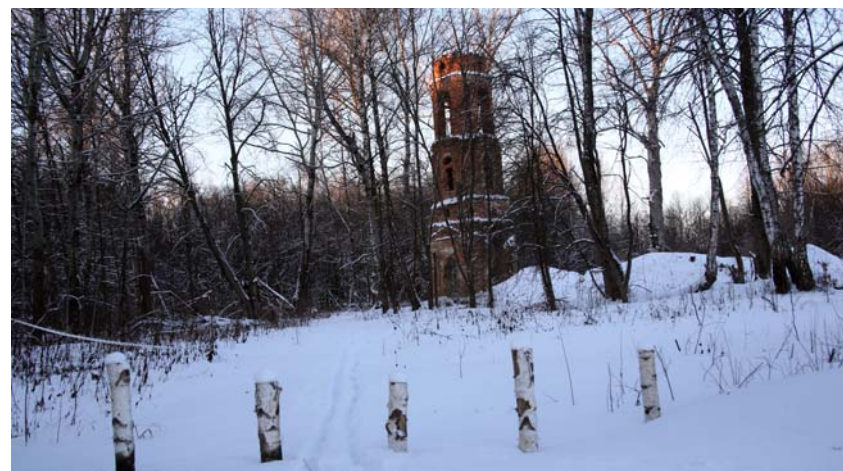
Вид на колокольню Успенской церкви. Фото 2015 г.