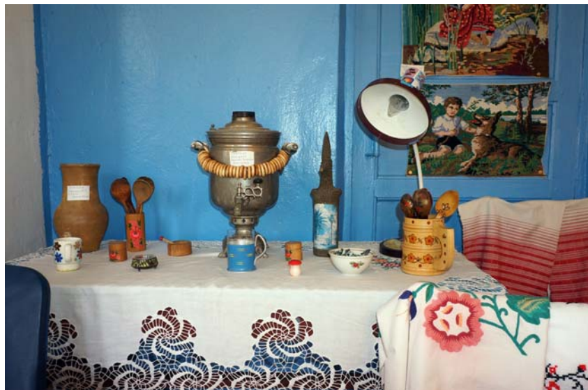
Крестьянская посуда. Фото 2014 г.