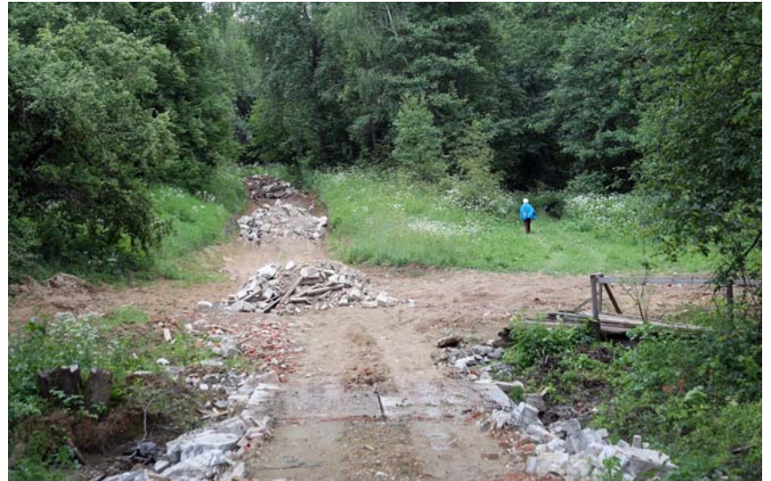
Отсыпка склона оврага. Фото 2014 г.