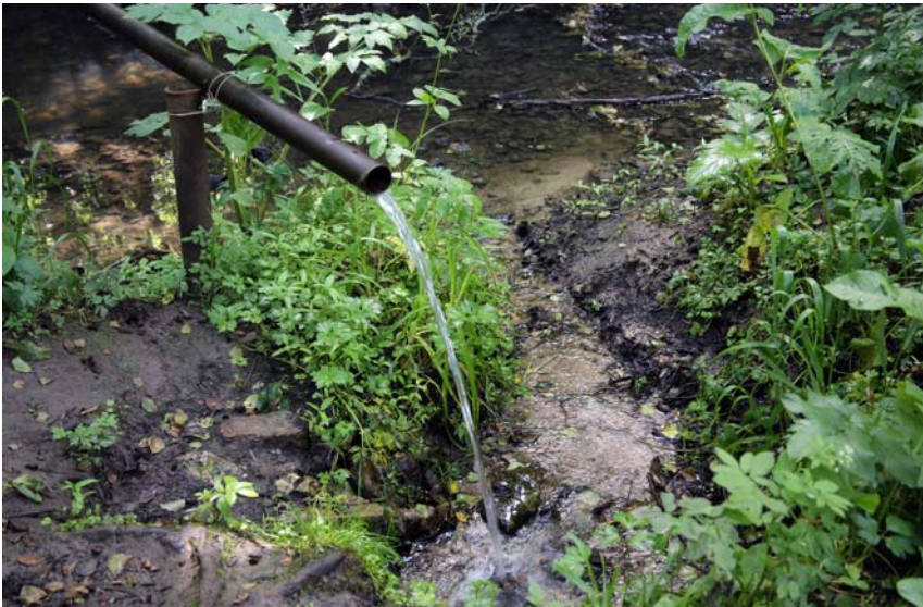
Родник с живой влагой. Фото 2014 г.