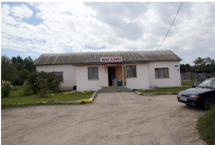
Сельский магазин. Фото 2014 г.