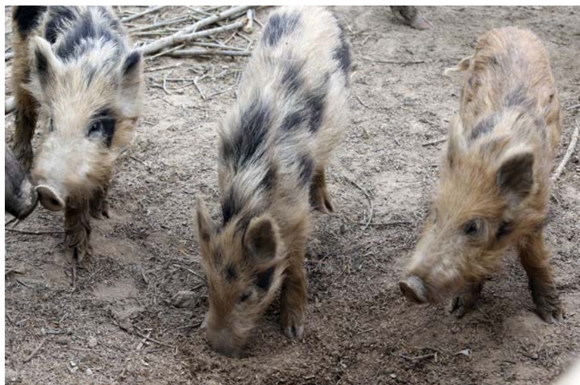
Подростшее молодое поколение. Фото 2014 г.