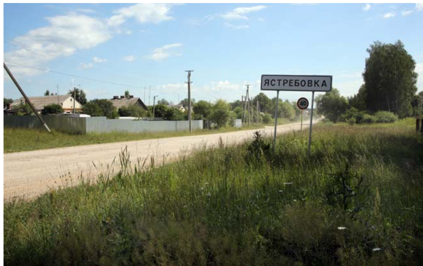
Въезд в сельское поселение «Деревня Ястребовка». Фото 2014 г.