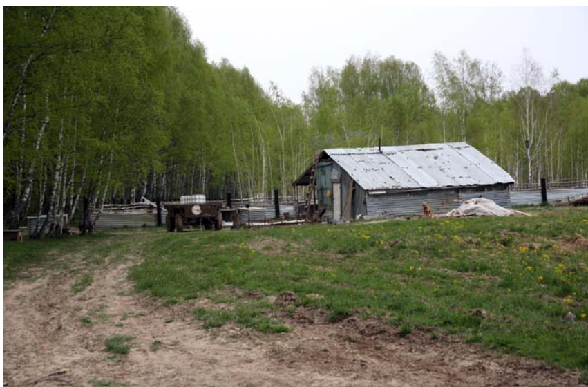
Вид на подсобное хозяйство. Фото 2014 г.