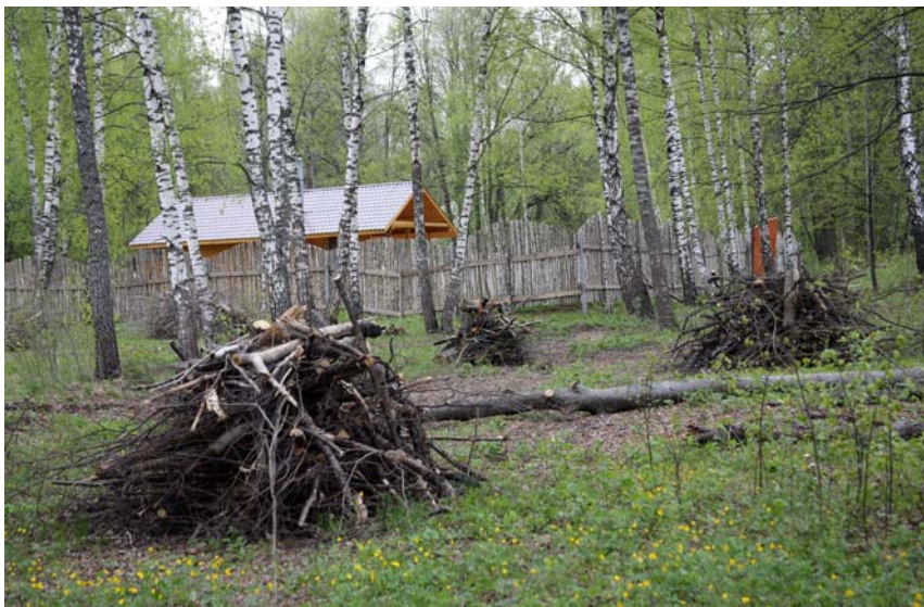
Благоустройство территории. Фото 2014 г.