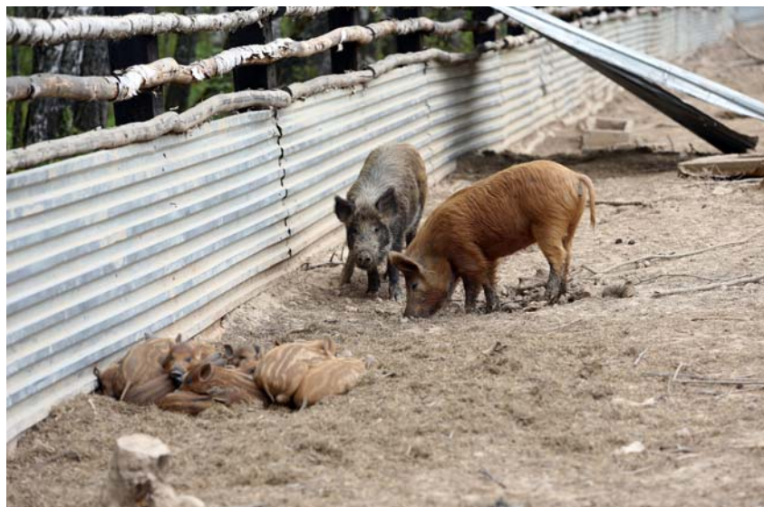
Подсобное хозяйство. Фото 2014 г.