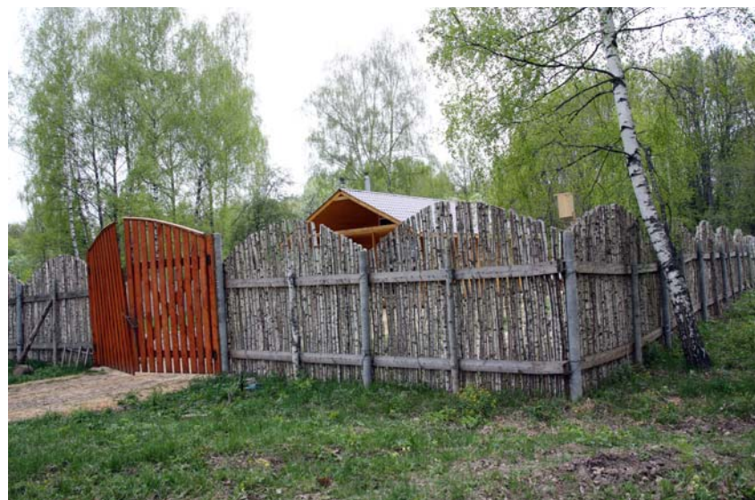
Изгородь из подручного материала. Фото 2014 г.