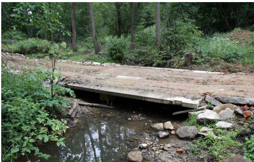
Новый железобетонный мост через речку Сельна. Фото 2014 г.