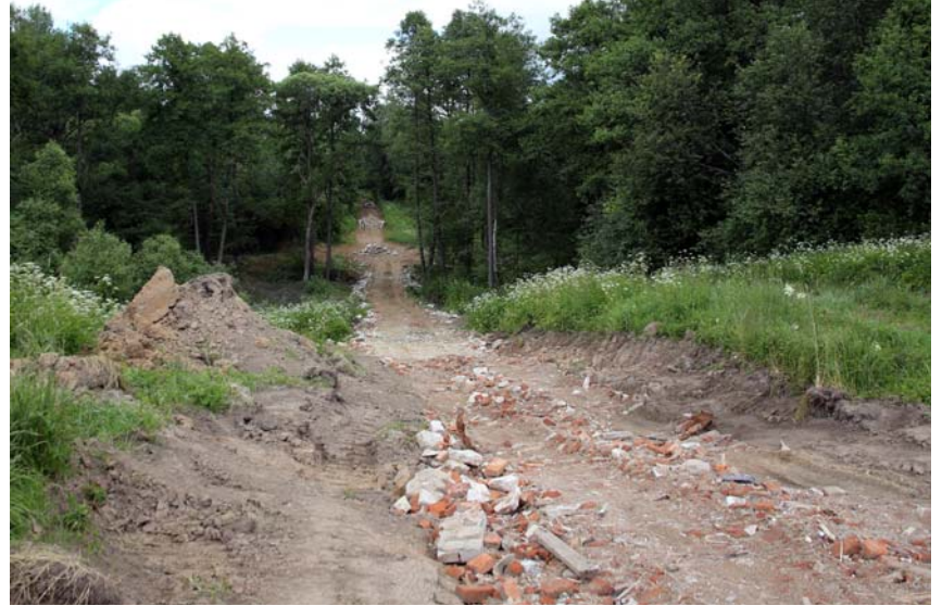
Вымощенная дорога в районе речки Сельна. Фото 2014 г.