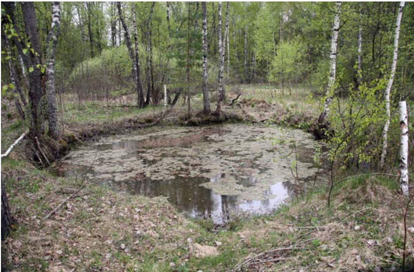
Лесное озерцо. Фото 2014 г.