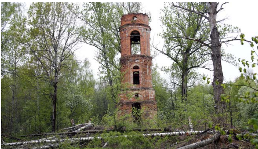
Начало работ по опиловке деревьев вокруг колокольни. Фото 2014 г.