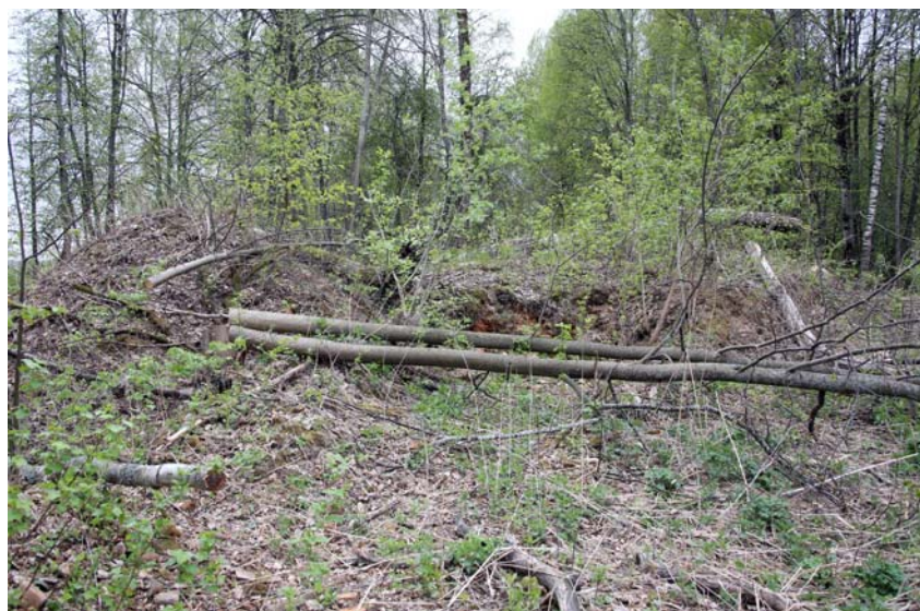
Руины Успенской церкви. Фото 2014 г.