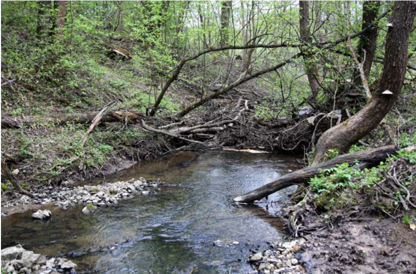
Речка Сельна в районе местного кладбища. Фото 2014 г.