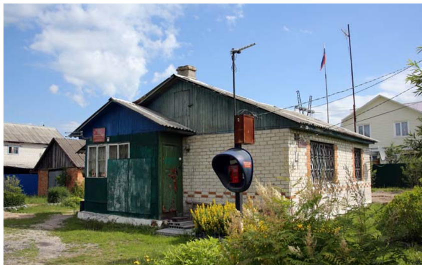
Здание администрации сельского поселения. Фото 2014 г.