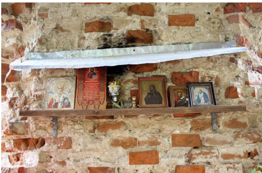
Импровизированный иконостас в колокольне Успенской церкви. Фото 2014 г.