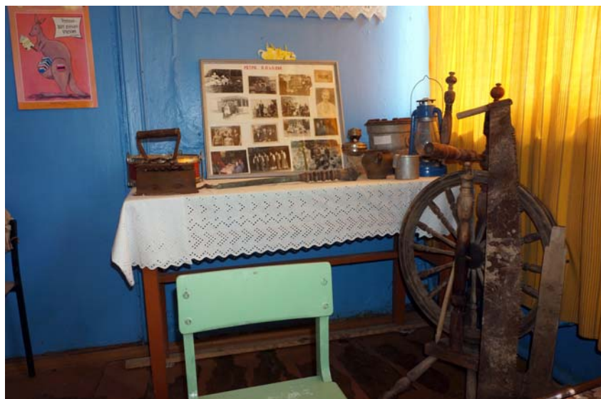
Музейная экспозиция. Фото 2014 г.