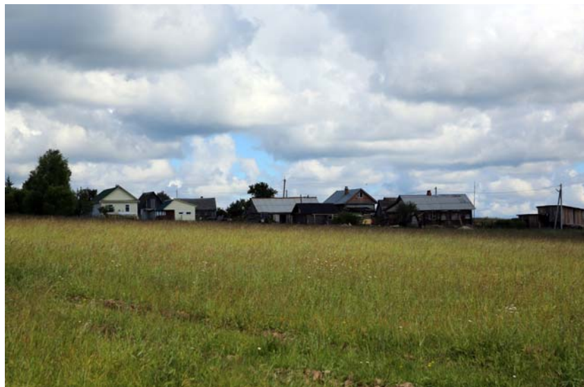
Деревня Филисово. Фото 2014 г.