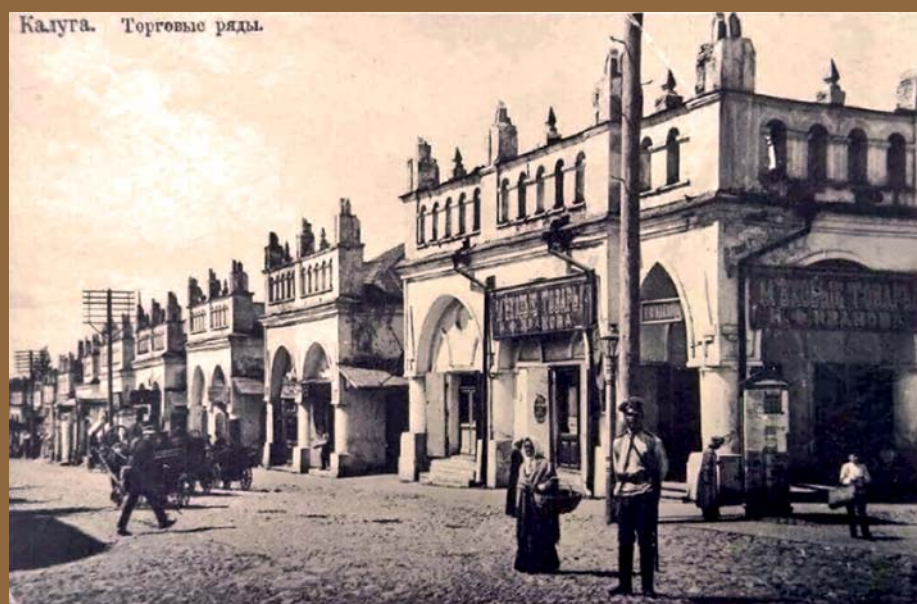
Калуга. Архитектурный ансамбль Гостиный двор (с. 30)

Журнал, посвященный истории и культуре Калужского края