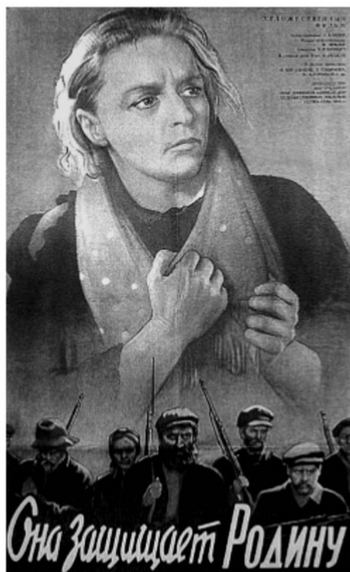
Афиша военных лет.

16 апреля 1943 года калужские газеты сообщали: «В парке Центрального кино» идет активная подготовка к летнему сезону — произведен ремонт танцевальной площадки, ограды, скамеек, полностью очищена территория парка, подготовлено для высадки в грунт 10 тысяч летних цветов. Кроме того, в «парковом хозяйстве» планируется выращивать до 50 000 штук рассады капусты, помидоров, свеклы. В номере от 16 мая 1943 года сообщается о скором открытии парка при кинотеатре «Центральный». С 12 мая, как написано в том же выпуске газеты, на экране кинотеатра демонстрировался документальный фильм «Сталинград». 27 июня 1943 года «Коммуна» писала о предстоящем показе фильма «Она защищает Родину». В октябре 1943 года на экраны вышли фильмы «Воздушный извозчик» и «Мечта», в ноябре — «Комсомольцы», «Два бойца», «Мои земляки». В феврале 1944 года шел фильм «Фронт», в мае 1944 года — «Кутузов».