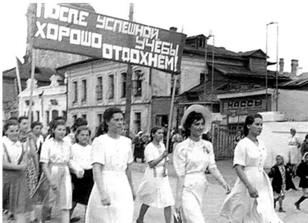
Демонстрация на улице Кирова. Конец 1940-х годов.