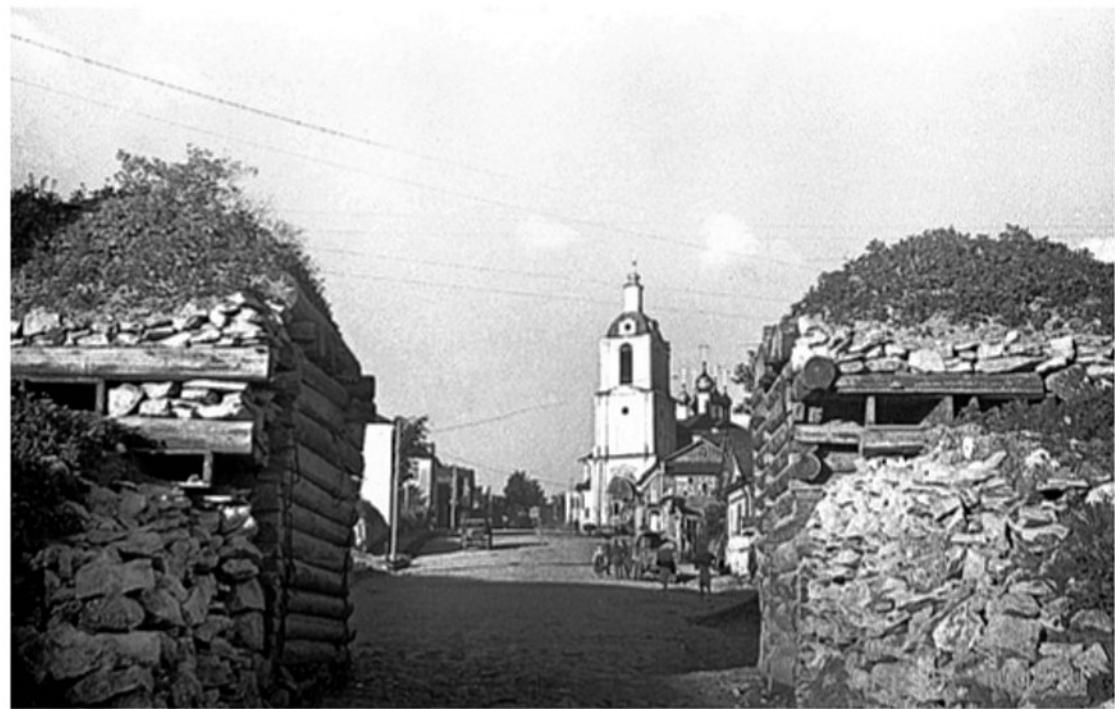
Двоты на Смоленской улице. Калуга, 1942 год.