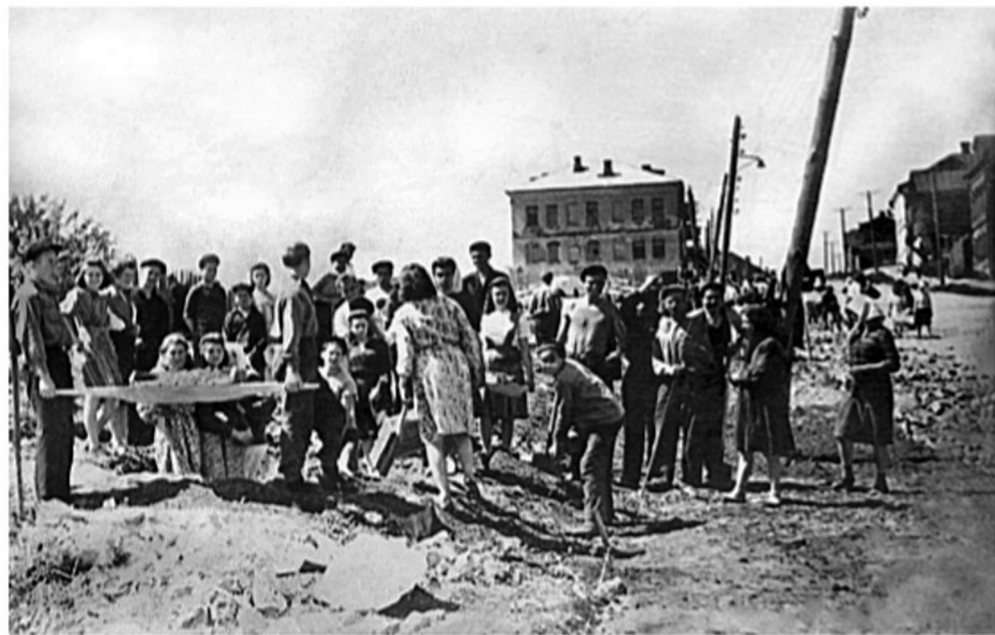
Субботник на улице Салтыкова-Щедрина. 1940-е.