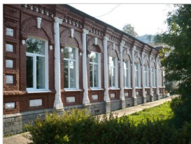
Усадьба городская XIX- нач. XX вв. (Н.Е.Журавлева). Флигель западный. ул.Луначарского, 57.

Здание построено в 1893 году по заказу медынского купца Б.Журавлева. На первом этаже был магазин для продажи писчебумажных принадлежностей, хозяйственные помещения и возможно кухня. Весь второй этаж был жилым.