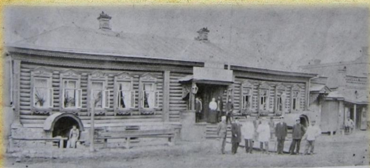
Народный дом, в котором располагалась чайная и читальня. Перемышль. Нач. XX в.